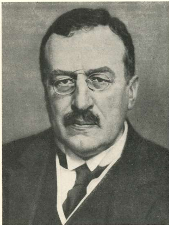
Sven Hedin Fil. Doktor

Vid Gillets sista möte för året valdes enhälligt den framstående forskaren och upptäcktsresanden dr. S v e n H e d i n till hedersledamot.