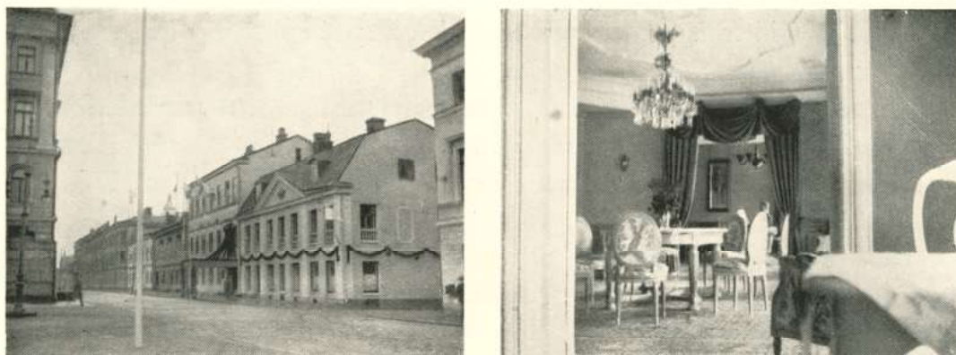
Svenska Gillets lokal i övre våningen av den s.k. Sederholmska gården, Helsingfors' stads äldsta byggnad. Bilderna äro tagna vid tiden för svenska kungabesöket.