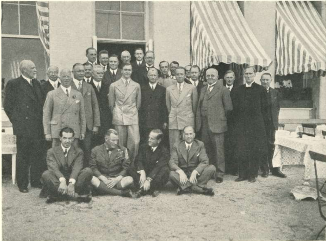
Från Svenska Gillets avskedslunch för prins Gustaf Adolf på Brändö Casino den 23 juli 1934.