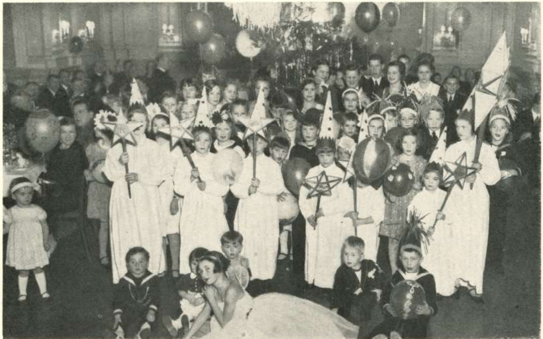
Gillet's julfest på Hotel Kämp den 13 jan. 1935

Den 9 november firades under anslående former en höstfest tillsammans med de danska och norska föreningarna i Helsingfors. Anslutningen var stor med bortåt 200 deltagare och försöket att sammanföra de nordiska föreningarnas medlemmar till en gemensam fest utföll synnerligen lyckligt. Närvarande vid den solenna festen voro förutom sveriges minister och fru von Heidenstam, danmarks minister kammarherre Lerche samt norske ministern Jakhell.